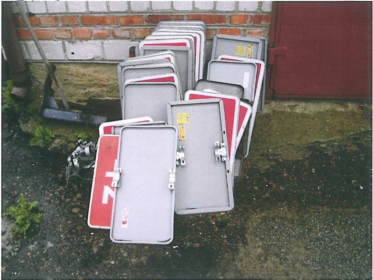
Bariery, rury od znaków