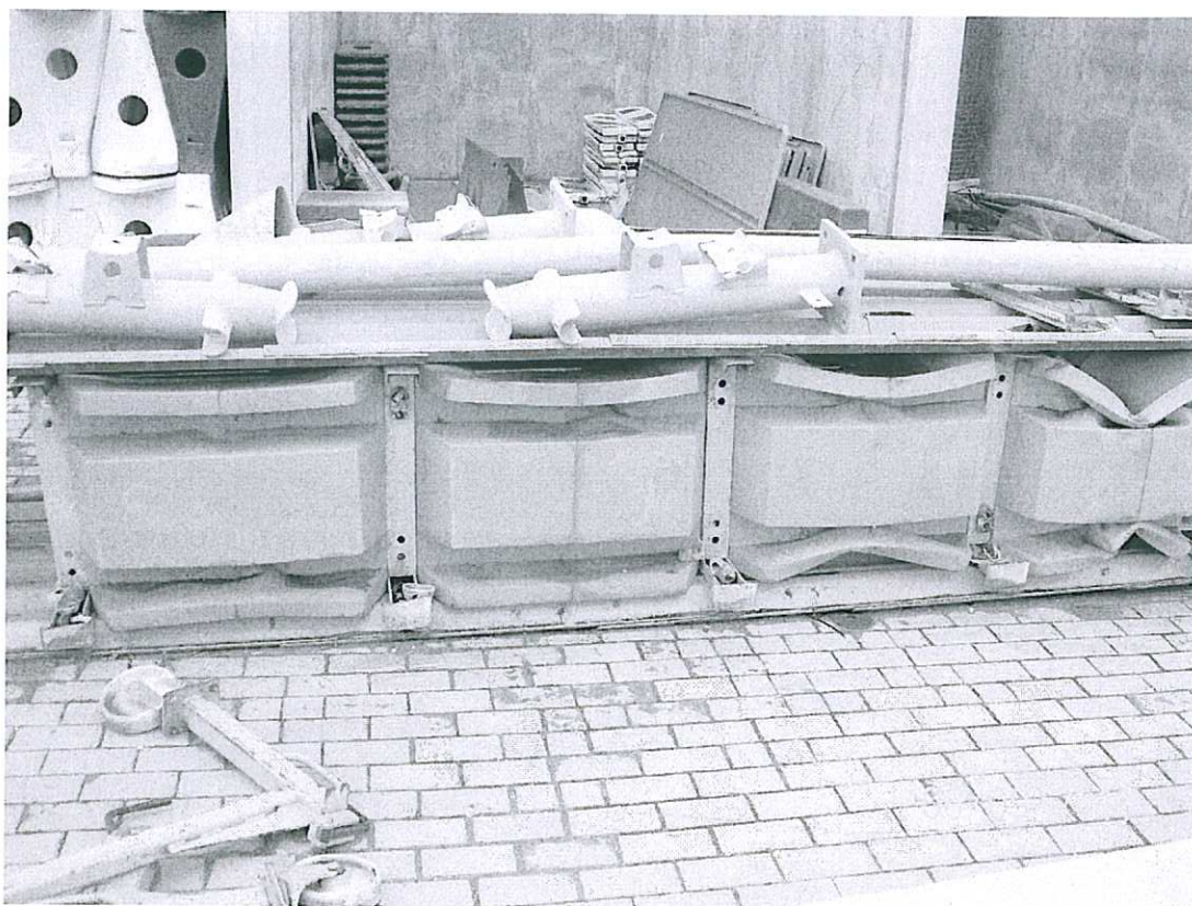
Poduszka zderzeniowa – urządzenie składające się w 1/3 z elementów stalowych i 2/3 z elementów plastikowych szt.1 waga około 400 kg.