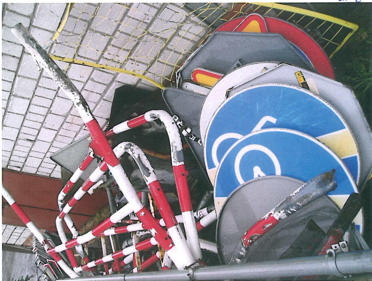
Znaki D, E, T, U